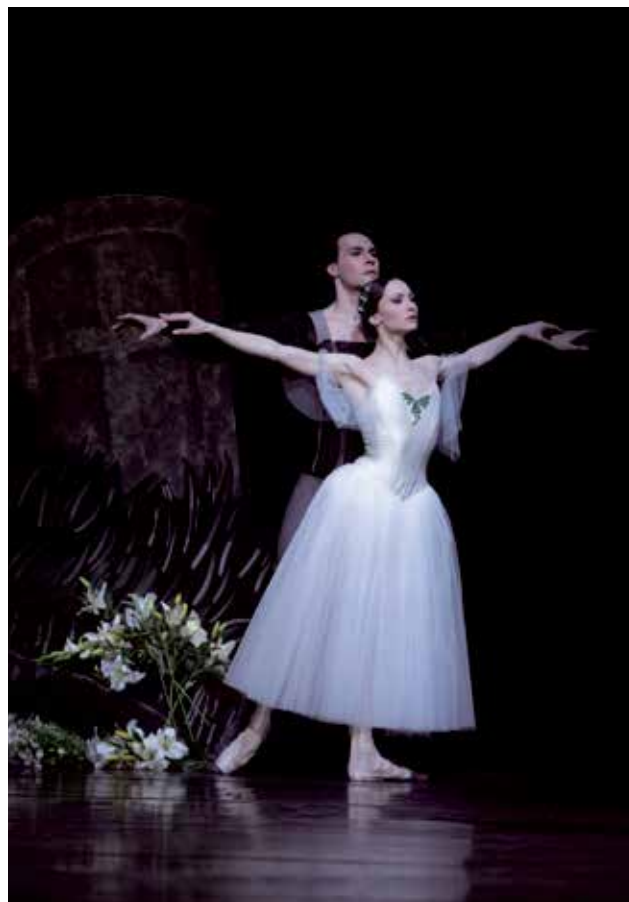
Het Muziektheater, HNB, Giselle

De vacatievergoeding voor commissieleden en bestuursleden bedroeg € 100 per vergadering.