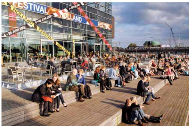
Holland Festival, Muziekgebouw aan 't IJ

Begin 2013 was het bureau van de kunstraad betrokken bij de argumentatie van de gemeente in de bezwaarprocedures tegen beschikkingen in het kader van het Kunstenplan 2013-2016. Het college heeft ten behoeve van het Kunstenplan 195 beschikkingen uitgestuurd. Hiertegen was in 6 gevallen bezwaar aangetekend. In twee gevallen oordeelden de juristen dat voor de argumentatie onvoldoende grond was. Ook de andere vier zaken vielen uit in het voordeel van de gemeente.