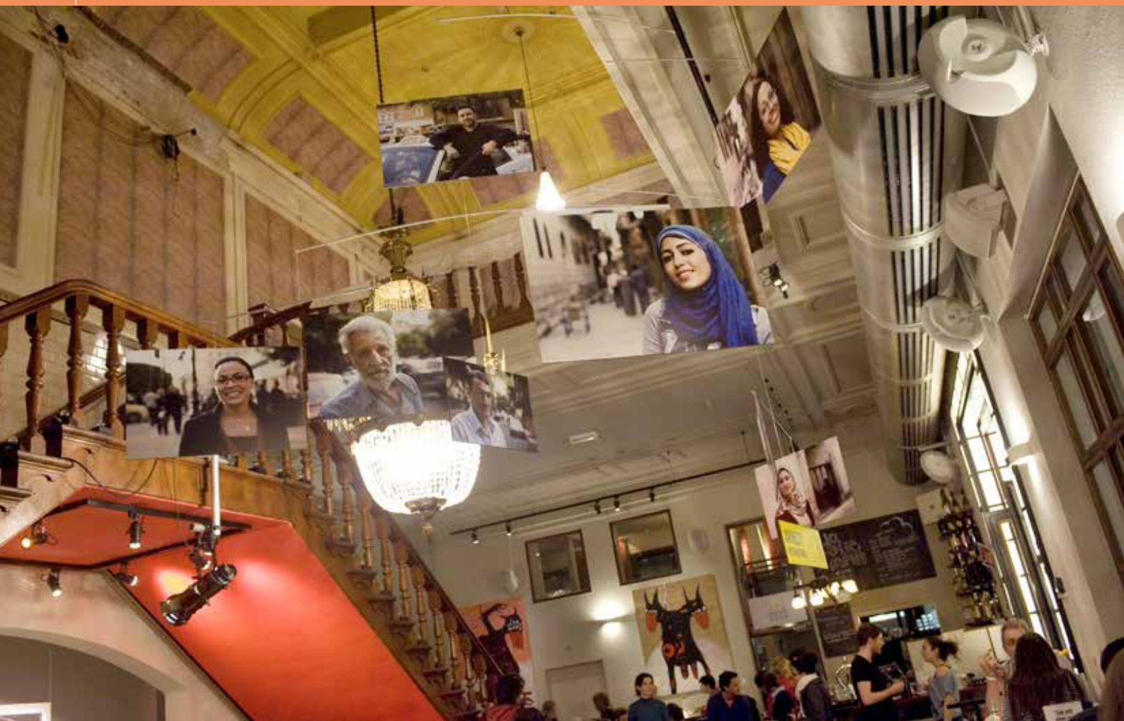
De Balie tijdens het Midden Oosten festival The Art of Revolution

De Amsterdamse Kunstraad is sinds 1952 het onafhankelijk adviesorgaan van het stadsbestuur op het gebied van cultuurbeleid. De kunstraad is onafhankelijk ten opzichte van de politiek, het ambtelijk apparaat en het culturele veld en adviseert eens in de vier jaar over de subsidieaanvragen voor het kunstenplan.